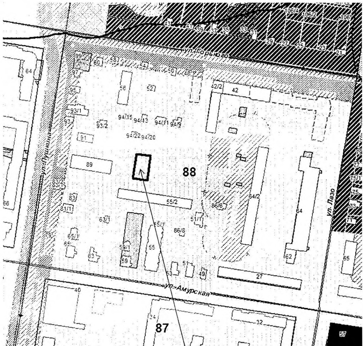
земельный участок с кадастровым номером 28:01:010088:15

к проекту постановления администрации города Благовещенска «О предоставлении разрешения на условно разрешенный вид использования земельного участка с кадастровым номером 28:01:010088:15, расположенного в квартале 88 города Благовещенска»